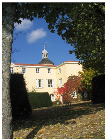
A LA NEYLIÈRE

« Si le Christ n'est pas ressuscité, alors notre prédication est vide et vide aussi notre foi ». (1 Co 15,14)