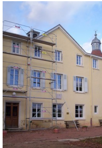
A LA NEYLIERE