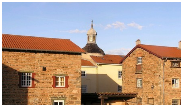
« Wallis et Futuna »

À La Neylière, où les annexes Wallis et Futuna restent ouvertes pendant les travaux.