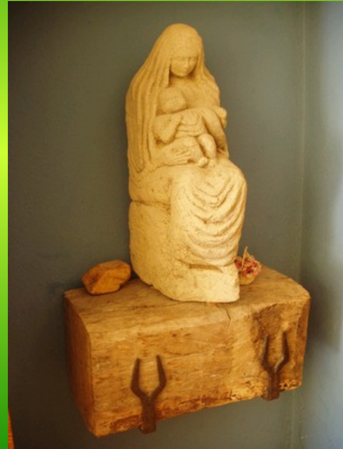
Notre Dame de l'accueil