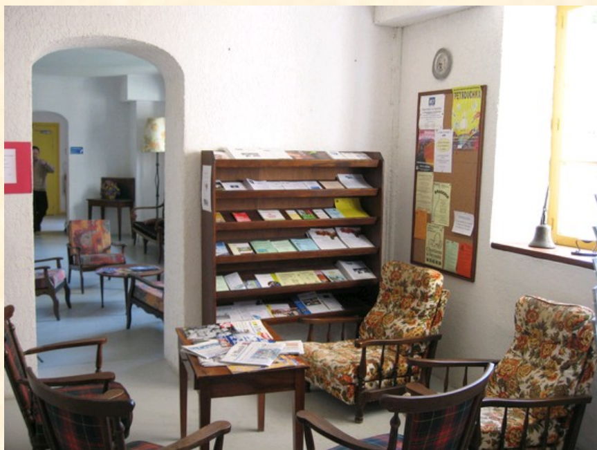
Coin lecture et journaux