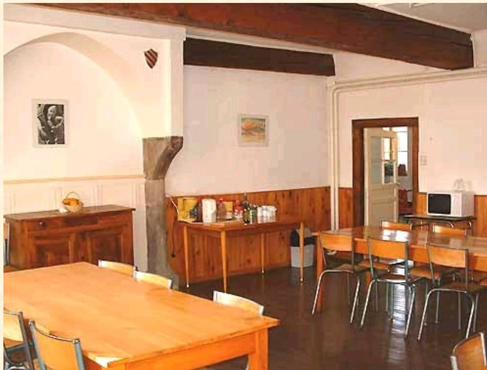
Salle à manger des lycéennes